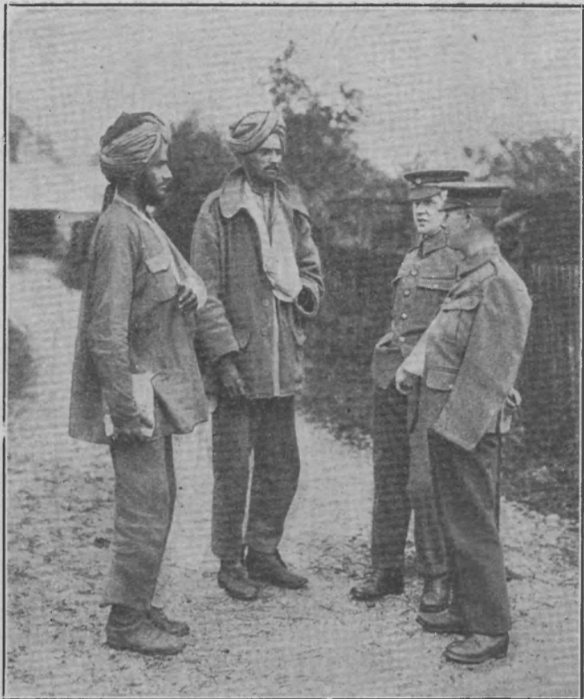
Первые раненые индусы въ английскомъ госпиталѣ.