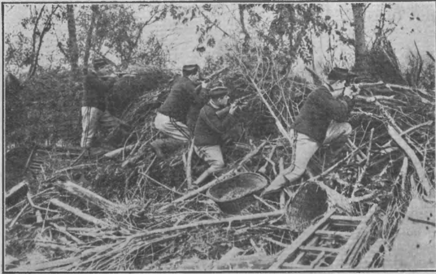
Бельгиские стрѣлки за баррикадой.

если-бъ не безумная бѣготня ея огромныхъ глазъ; можно было-бъ спросить ее, какъ разумную, если-бъ не дикая улыбка ея распухшихъ и посинѣвшихъ губъ.